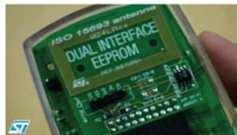
Рис. 3. Пример использования микросхемы M24LR64 в электронных устройствах