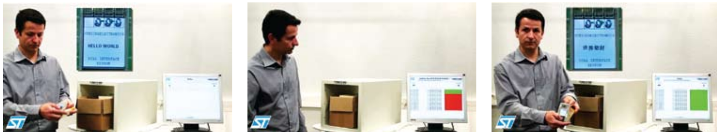
Рис. 4. Локализация программного обеспечения электронных устройств, включающих микросхему M24LR64

какая-либо путаница. Помимо этого, какие-то версии изделий могут оказаться в избытке, а какие-то, наоборот, отсутствовать в необходимых количествах. Далее — внесение изменений (пусть даже несущественных) в программный код предполагает либо возврат изделий на перепрошивку, либо отгрузку потребителю изделий с устаревшей версией программного обеспечения.