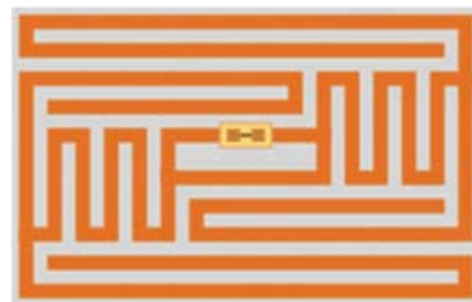
Рис. 1. Внешний вид и RFID-метка проездного билета московского метрополитена

ется в заказных специализированных микросхемах (ASIC), опять-таки, как средство коммуникации с микроконтроллерами. Иными словами, для микроконтроллера (или для микросхемы ASIC) микросхема M24LR64 представляет периферийную микросхему архивной памяти.