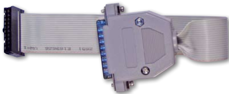
Рис. 3. Программатор-эмулятор TMS320-JTAG

Лабораторная отладочная плата TMS320-P28016 на базе DSP TMS320F28016 позволяет разработчику быстро приступить к изучению процессора, используя проверенную производителем аппаратуру (рис. 2). Этот DSP — один из самых недорогих на рынке, но при этом обладает вполне достойными характеристиками — 32-разрядный прибор работает на частоте 60 МГц и обеспечивает производительность 60 MMACS. Плата включает типовую конфигурацию контроллера на основе DSP для управления электроприводами, а также макетное поле, вдоль которого расположен штыревой разъем с сигналами портов