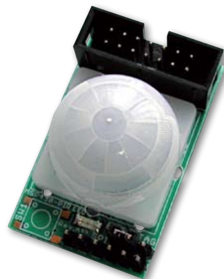
Рис. 1. Плата датчика движения MSP430-PIR

В настоящее время в семейство MSP430 входит около 140 типов микроконтроллеров. Микроконтроллеры линейки MSP430F20xx Tiny с тактовой частотой 16 МГц и напряжением питания 1,8...3,6 В изготавливаются в 14- и 16-выводных корпусах. Они предназначены для использования совместно с сенсорами и приходят на смену линейке MSP430x11xx с тактовой частотой 8 МГц. Программирование флэш-памяти программ и отладка резидентного ПО ведется через интерфейс типа SBW (Spy-Bi-Wire Interface). Этот двухпроводной JTAG-интерфейс при отладке позволяет рабочей программе использовать практически все линии портов микроконтроллера.