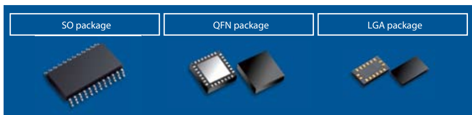
Рис. 3. Варианты корпусного исполнения акселерометров фирмы ST

Варианты корпусного исполнения показаны на рисунке 3.