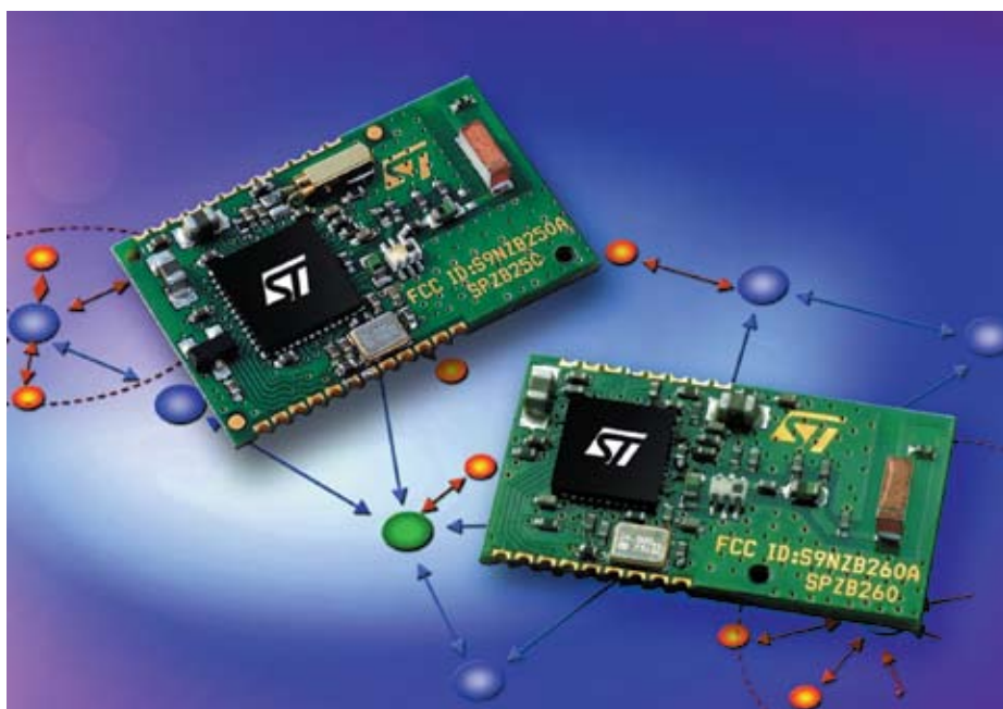
Рис. 1. Внешний вид SPZB250 и SPZB260